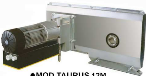
● MOD.TAURUS 12M (EA-00004-00) + (EA-00062-00)