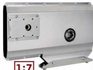
● MOD.MOTOR BRACKET (EA-00062-00)